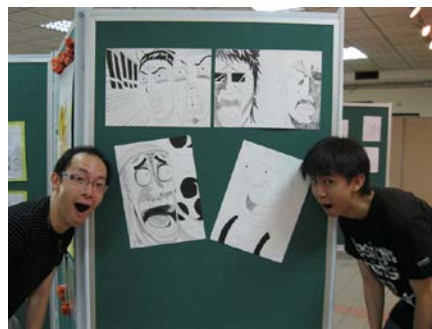
「吾係 Y 畫」2011年5月1日@天恩堂副堂