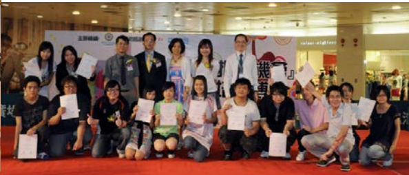
「漫研社」2010年12月12日@天恩堂副堂