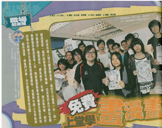
「免費上學畫漫畫」課程，由資深漫畫家及導師指導，學生在課堂中學習繪畫技巧，並完成多項漫畫作品。

【本報訊】一雙手可以打天下，加一支畫筆威力更大。近年港漫市場培訓市場的興起，培訓新一代接班人，由資深漫畫家及導師指導，學生在課堂中學習繪畫技巧，並完成多項漫畫作品。 「免費上學畫漫畫」課程，由資深漫畫家及導師指導，學生在課堂中學習繪畫技巧，並完成多項漫畫作品。 課程內容包括：漫畫基本工具、繪畫技巧、故事創作、分鏡、上色、印刷等。 課程由資深漫畫家及導師指導，學生在課堂中學習繪畫技巧，並完成多項漫畫作品。