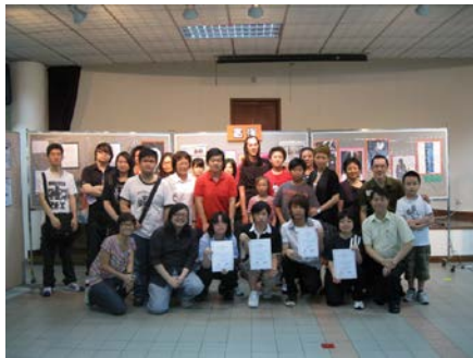
「潮漫」2010年8月22日@荷里活廣場