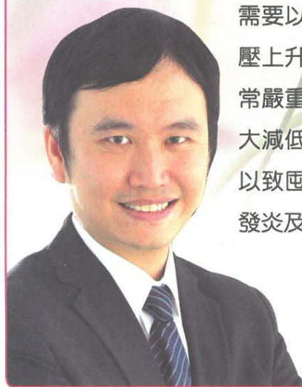
黃至生教授 香港中文大學醫學院公共衛生及 基層醫療學院副教授

雖然一般便秘對大部份長者並不構成生活困擾，但較嚴重的情況可引致痔瘡、大便出血、肛門損傷及腹部疼痛。因便秘患者可能需要以較大力度排便，患有高血壓者可能會血壓上升，影響心腦血管，或致中風。此外，非常嚴重的便秘可導致大便失禁、情緒困擾，大大減低生活質素。若糞便在大腸內不能被排出以致囤積，可引起腸道阻塞、腸臟潰瘍、尿道發炎及直腸下垂等。