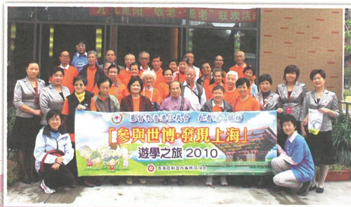
參加者探訪上海市延吉護老院

長者們對上海市退休教工服務中心交流和表演特別感新鮮和親切感。此外，透過參觀上海世界博覽館和城市規劃展覽館、坐磁懸浮列車等，使他們更認識祖國的發展、國力的強大。而全程中心同事、領隊和導遊們都悉心照顧、細心安排，團員之間亦互相關照，使他們深受感動，行程畢生難忘。