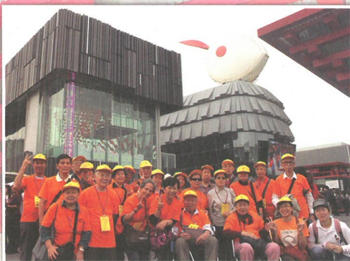
參加者在世博香港館及澳門館前留影

「BB有便便啦！」然後媽媽很高興地將這個訊息傳給一眾親朋戚友。這是近期一個奶粉廣告，輕鬆地道出一個大人細路都面對的煩惱——「便秘」。