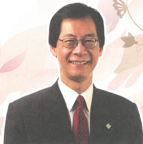
唐偉章 香港理工 大學校長