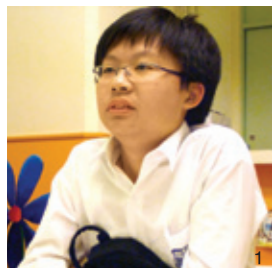
1. 因沉迷打機，不能在祖母臨死前見她最後一面，成了徐仔的遺憾。

徐仔現在讀中二，他自小學四年級開始沉迷於電腦遊戲中，他告訴我們情況是這樣的：每天除了上學以外，其餘時間都用來上網打機，每星期打七十二小時。由於要盡用一切時間，所以通常兩天才洗一次澡，刷牙的功夫更是省略了。