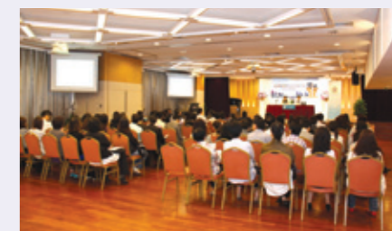
打破管理代溝共融策略分享會現場情況

* 本機構同時為企業度身訂造持續性培訓方案，有效改善企業隔代管理問題，歡迎查詢。