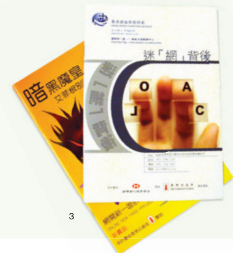
2. 社工阿熙以同行者的方式幫助徐仔重建平衡生活。 3. 香港基督教服務處為推廣網絡沉溺輔導服務印製的小冊子。

徐仔分享說因為小組的社工太瞭解他且不會強迫他，而且真誠地欣賞他付出的努力，這一一成了他作出改變，成功自我節制的動力。