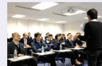
個別企業分享工作坊