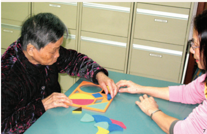
7, 8. 坊間一些遊戲用品也可用於訓練失智症長者。

對綺玲來說，最能幫助她的，是讓她認識了一班同路人，大家可互相分享照顧上的點滴與及曾試過的處理方法。她說：「大家也在照顧失智症的家人，會很明白當中的困難，較同聲同氣，感覺很親切，而且聽了其他家庭的分享，