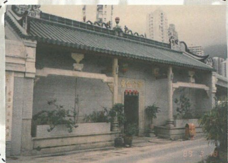
筲箕灣譚公仙聖廟

亞公岩海旁有船隻修理廠數間，十八世紀末，該地為石材出口港，故海邊常有大批艇（俗稱大眼雞）停泊。其後，該地為漁船避風港，不少船隻停泊該處，故有眾多修理廠之設立。各船廠亦有建造龍舟，供每年端午節龍舟活動之用。至二十世紀末，該區填海，漁船轉泊他處，船隻修理廠之數目大減，今餘數間，規模不大。