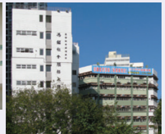
恩頤居所在地： 馮鑑社會服務大樓 2-5 樓