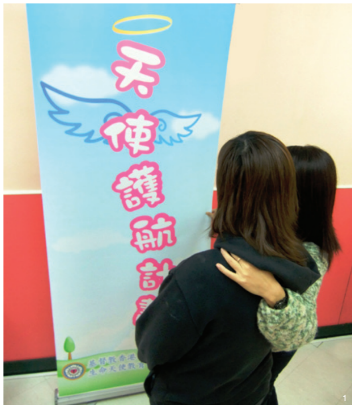
1. 蕊於一年前加入了「天使護航」計劃。